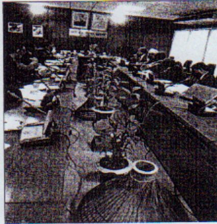
মন্ত্রণালয়ে ইনোভেশন কমিটির সভা

মন্ত্রণালয়ের অধীনস্থ দপ্তর সমূহের ইনোভেশন কমিটির সভা নিয়মিত হচ্ছে কিনা তা মন্ত্রণালয় থেকে নিয়মিত পর্যবেক্ষণ করা হয়ে থাকে। মৎস্য ও প্রাণিসম্পদ অধিদপ্তরে উদ্ভাবন উদ্যোগ নিয়ে ০২টি শো কেইস করা হয়েছে। ইনোভেশন উদ্যোগ বাস্তবায়নে বিভিন্ন ধরনের সহযোগিতা করা হচ্ছে।