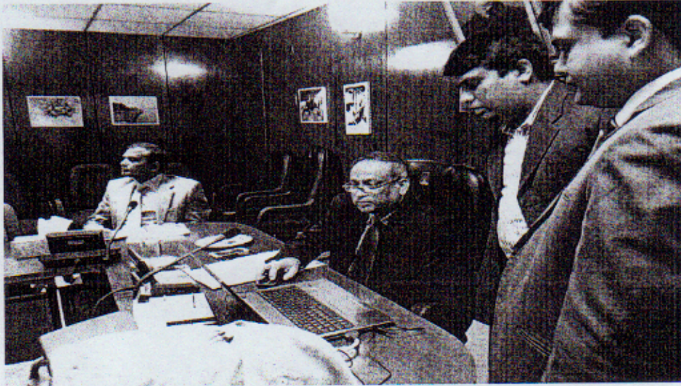
মৎস্য ও প্রাণিসম্পদ মন্ত্রণালয়ের মাননীয় সচিব মহোদয় মন্ত্রণালয়ের ই-ফাইলিং কার্যক্রমের শুভ উদ্বোধন করছেন